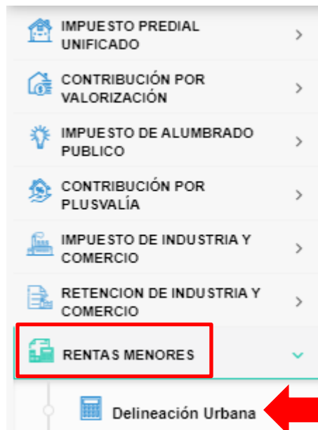
Figura 2. Panel Vertical

Para acceder al módulo de delineación urbana, por favor ubicarse en el menú vertical, desglorar la opción de rentas menores y escoger delineación urbana.