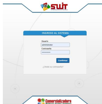
Figura 1. Ingreso al sistema

Para ingresar a la plataforma, digitar las credenciales asignadas