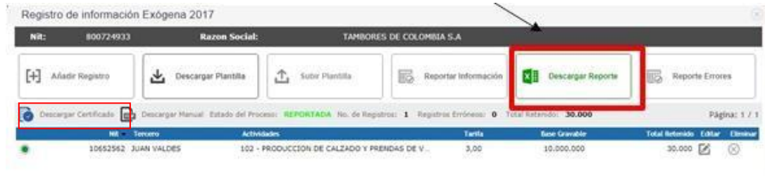
Figura 15. Descargar certificado de envío de información exógena.