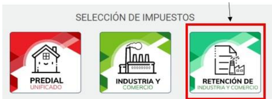
Figura 3. Panel de selección de Impuesto.