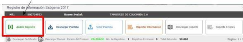
Figura 6. Selección del Registro.