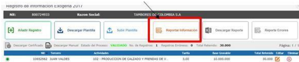
Figura 13. Opción reportar información exógena.