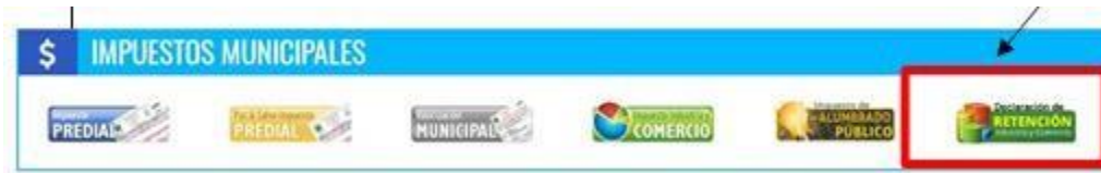
Figura 1. Panel de Selección Impuesto Portal Público Tributario.