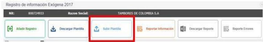
Figura 11. Opción para subir plantilla.