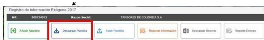
Figura 8. Descargar platilla.