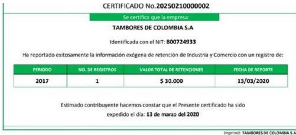
Figura 16. Certificado de envío de información exógena.